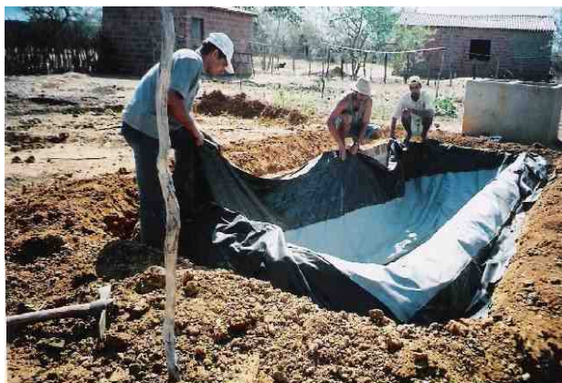
FOTO 2 – Instalação do biodigestor em Cacimba do Silva (Juazeiro – BA).

DA BAHIA e do PROGRAMA RENOVA BAHIA – PROGRAMA DE ENERGIA RENOVÁVEL DA BAHIA, que têm estudado e divulgado os benefícios do biodigestor como mecanismo de desenvolvimento limpo e inovação tecnológica no sertão nordestino, para combate a pobreza e a fome.