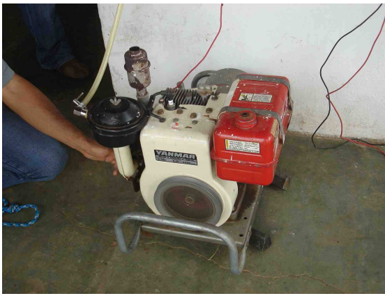
FOTOS 3-7– Benefícios sociais, ambientais e econômicos na comunidade de Cacimba do Silva (Juazeiro-BA) com a adoção do Mecanismo de Desenvolvimento Limpo (MDL). a) Capim-Tifton-85 adubado com biofertilizante; b) Uso do biofertilizante na horta comunitária; c) Biogás utilizado no processamento do leite de cabra, diversificando os produtos, agregando valor, melhorando logística, c) Biogás como combustível de motor gerador de eletricidade, na EBDA, em Jaguarari – BA.

O biodigestor, como ferramenta tecnológica de desenvolvimento sustentável, apresentou alto potencial de replicação na agricultura familiar, pois tem alta relação benefício/custo com a geração de biogás, contribuindo diretamente para melhoria da